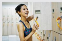
ロッカー利用、 更衣室でお着替え