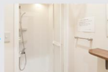
シャワー、お着替え