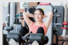
本格マシンで トレーニング